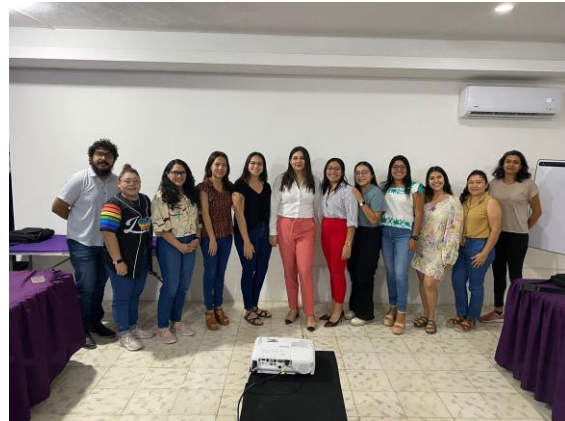
Plática "Cultura de la Denuncia" impartida a SEMUJERES