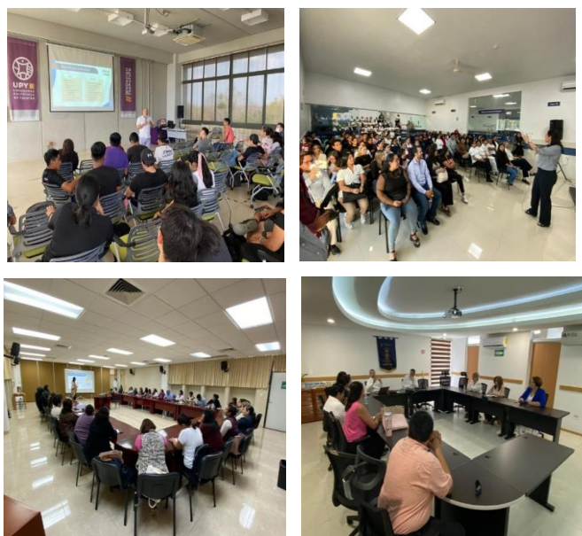
Actividades encaminadas a fortalecer la Cultura