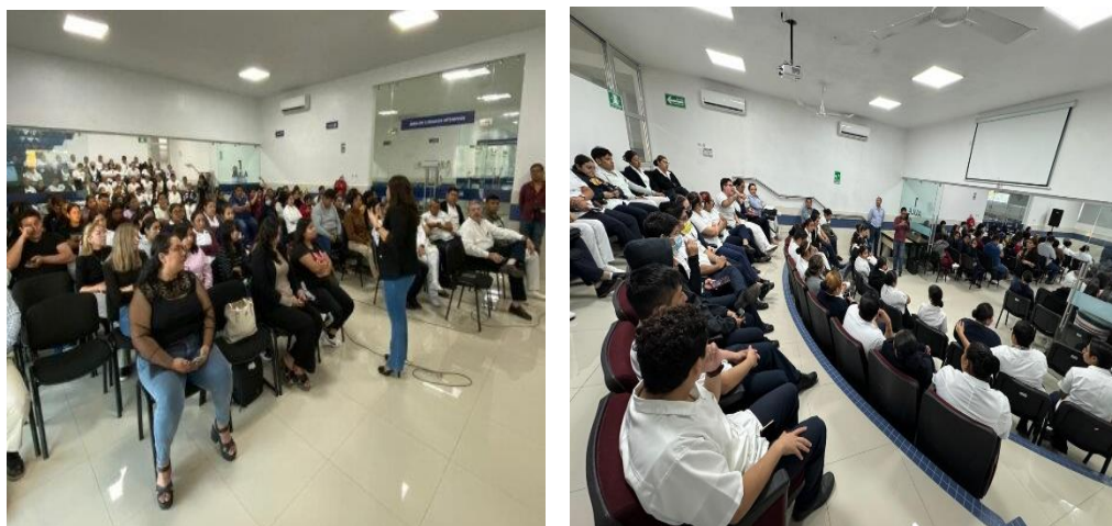
Acciones de colaboración realizadas con los Comités de Ética Estudiantiles